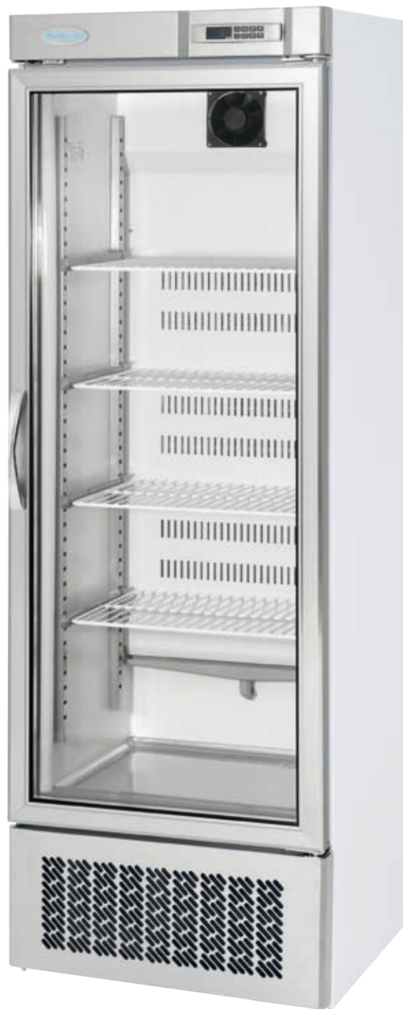
AEC 330 R